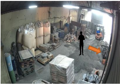
다른 방향을 응시 중인 재해자