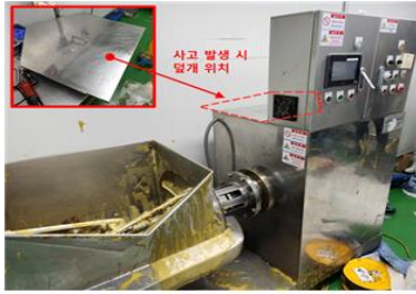
사고 발생 시 덮개 위치