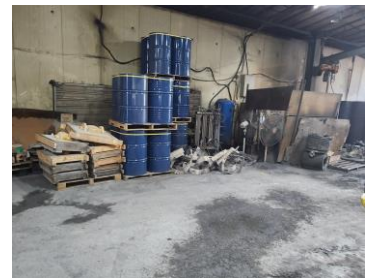
사고 현장 사진

'22.11.9.(수) 15:17경, 화성시 소재 사업장에서 지게차 운전원이 지게차 후진을 통해 자재를 운반하던 중, 다른 방향을 보던 재해자를 인지하지 못하고 후진하여 지게차와 충돌, 병원으로 이송하여 치료 중 작업자가 사망함