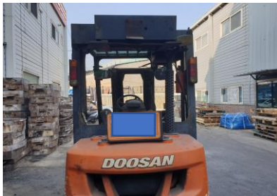
지게차 경보등 미설치