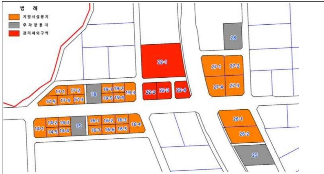
화성 발안 일반산업단지 지원시설구역 획지구분도