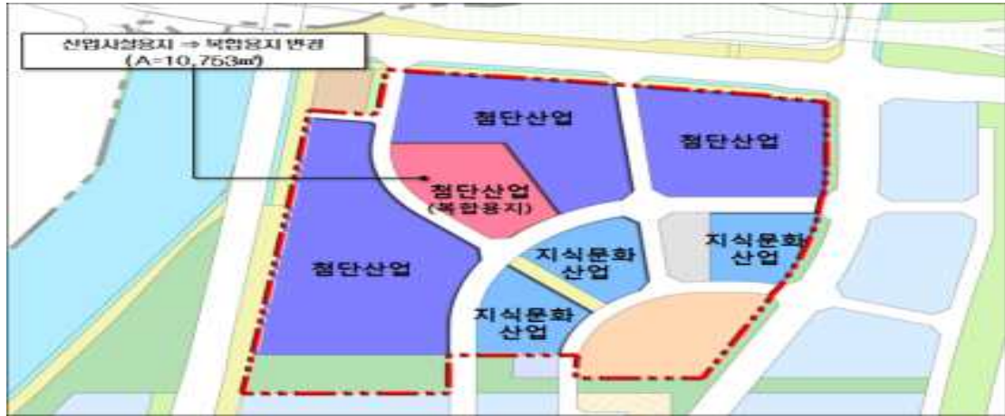
[붙임 3] 업종별 배치계획 평면도