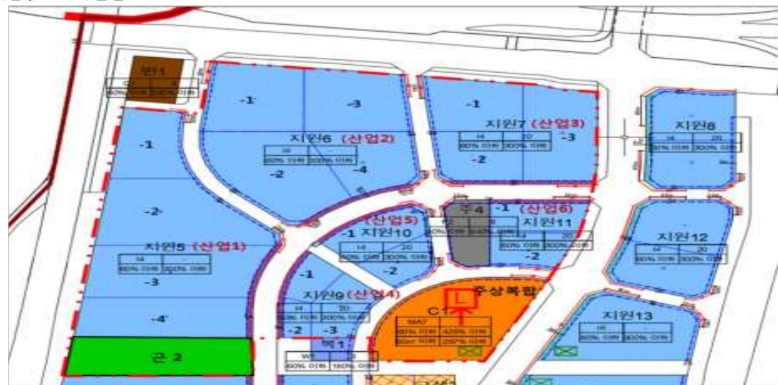
[붙임 4] 가분할도